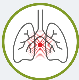
مشکل در تنفس